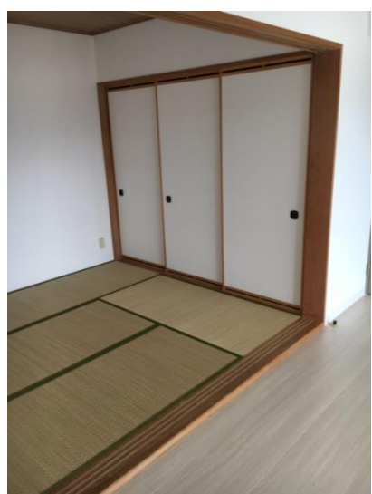
和室 (6 畳)