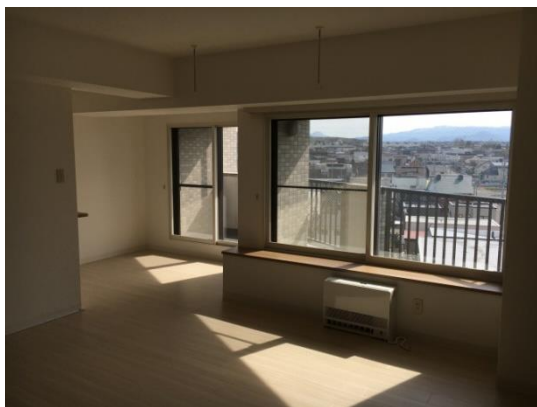
リビング (14.5 畳)