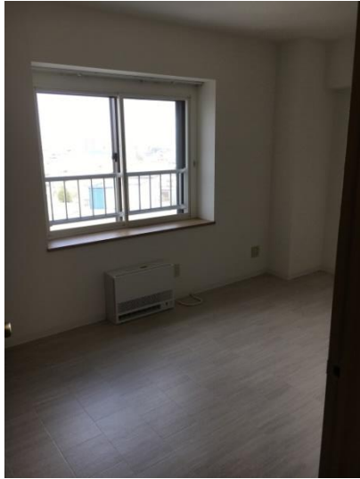
洋室 (6.5 畳)