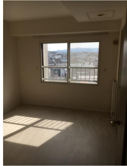
洋室 (6 畳)