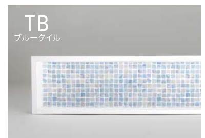
< ※ セラール FAN1721 ZMN >

※製品に関する詳しい情報は、当社 WEB サイトまたは施工説明書をご覧ください。