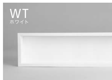
< ※ セラール FKM6000 ZMN >