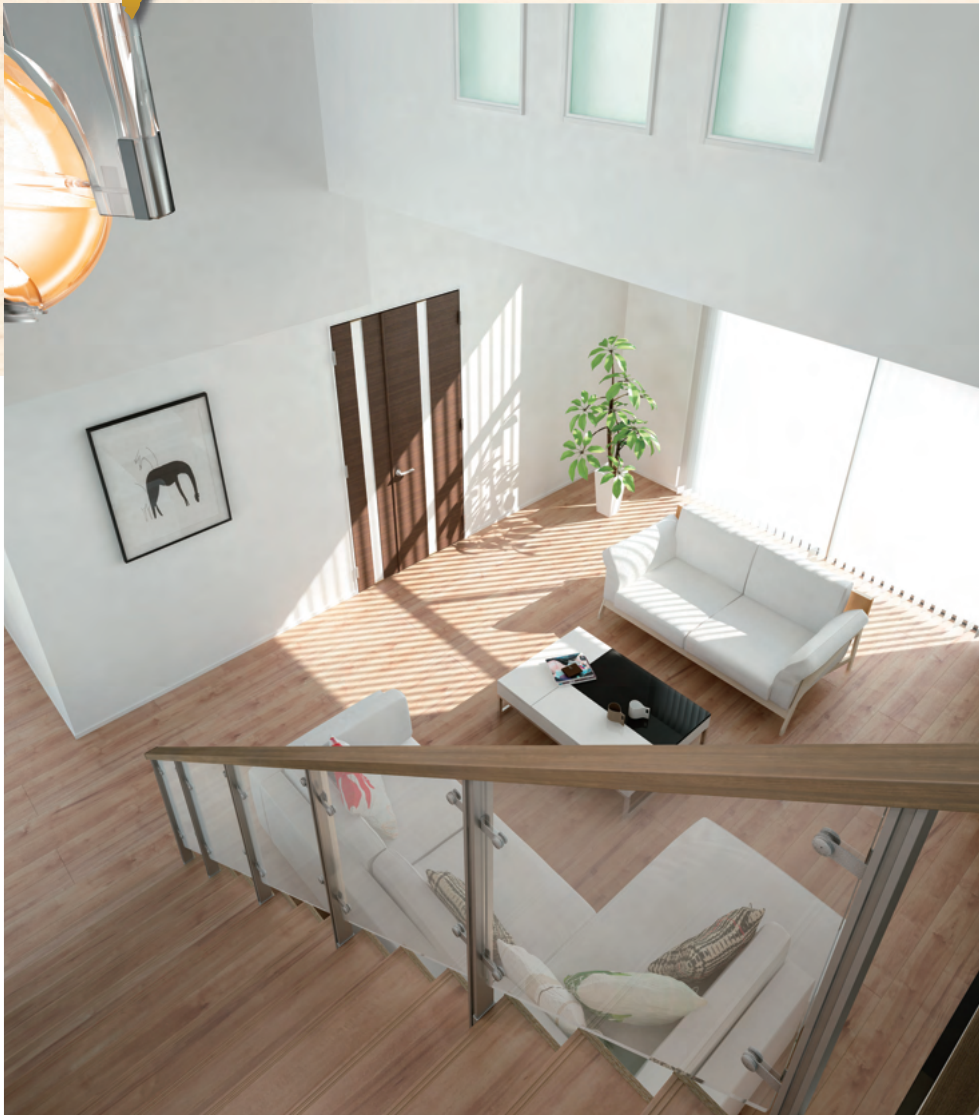
床材：夢フロア-S〈ココナッツブラウン〉TDI-K