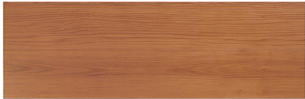
TD I-L (ライトブラウン)