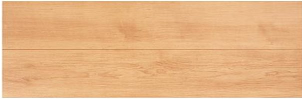
TD I-B (ベージュ)