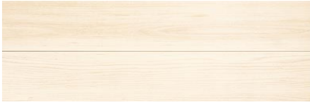
TD I-W (ホワイト)