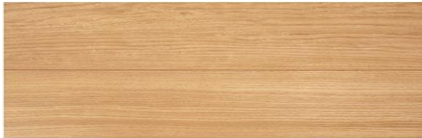
TD I-R (オータムリーフ)