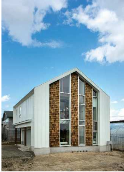
SF 設計：建築設計事務所 Atelier CoCo