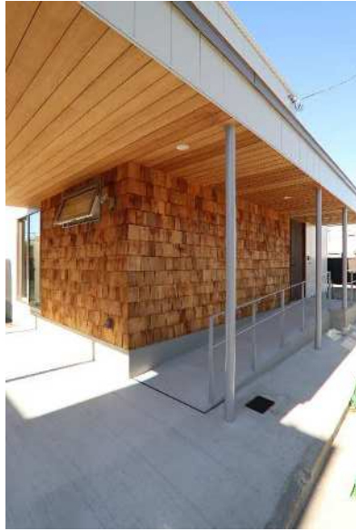
SF 施工：株式会社中川組