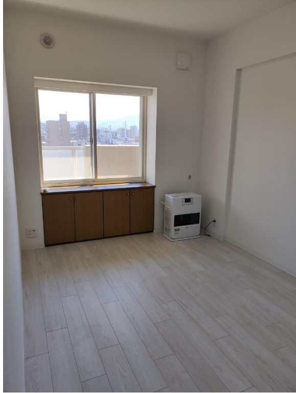
洋室 6.1 帖