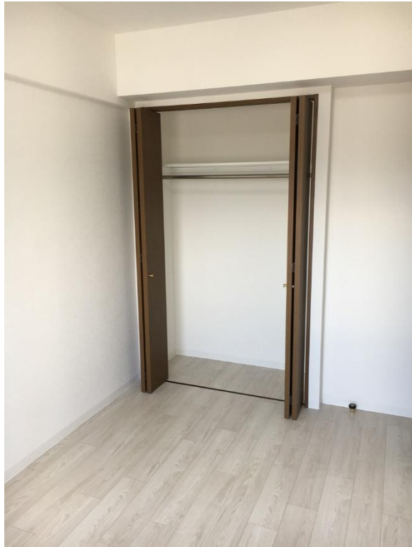
洋室 6.1 帖 クローゼット