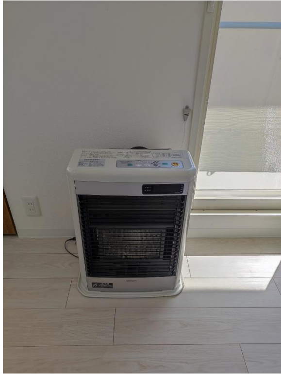
リビングの暖房機