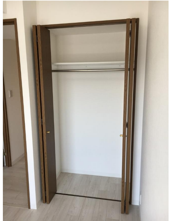
洋室 4.4 帖 クローゼット