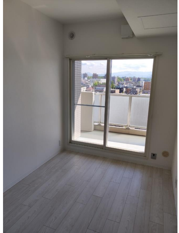
洋室 4.4 帖