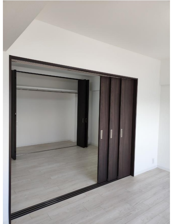
和室から洋室へ変更