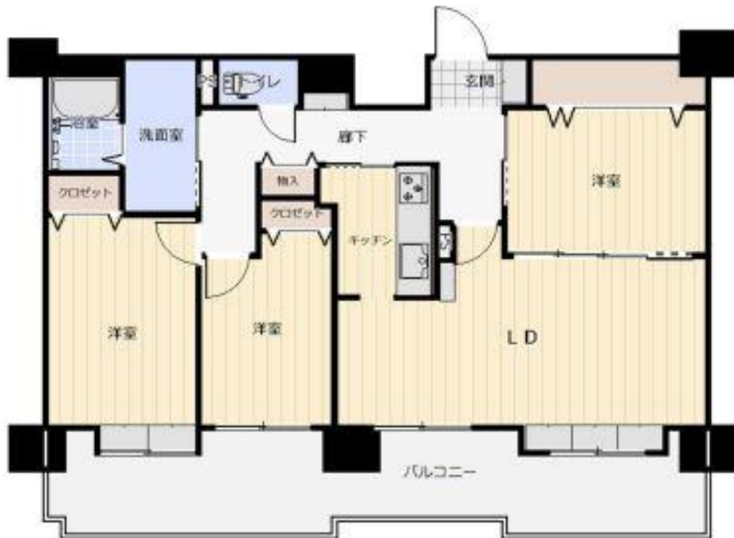
間取り図 (イメージ図)