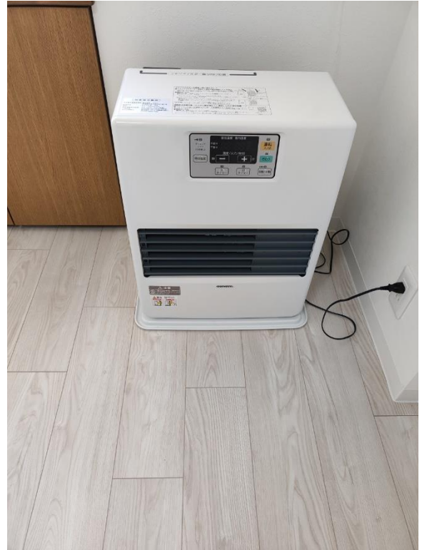
洋室 6.1 帖の暖房機