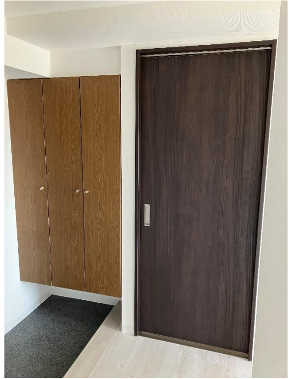
玄関収納と新設した引戸