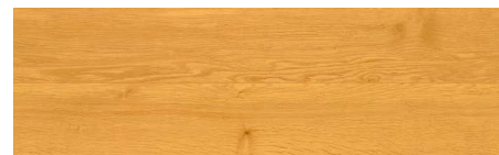
JR03 ミニマル・オーク