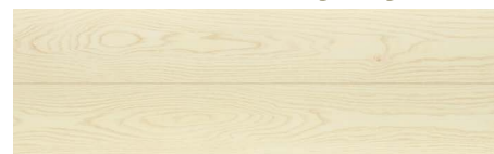
JR01 ミニマル・チェスナット