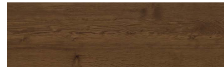
JR08 エリソン・ショコラオーク