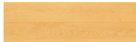
JR02 ミニマル・メイプル