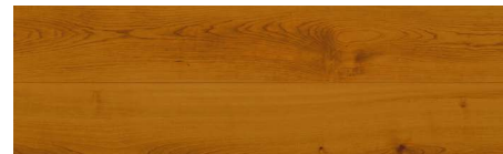
JR04 ミニマル・チェリー