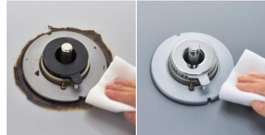
イージークリーン非搭載 イージークリーン搭載

バーナー周りの熱を分散・放熱させて表面温度の上昇を抑えます。煮こぼれや油はねなどの汚れが焦げつきにくく、簡単なお手入れだけで、キレイを保ちます。