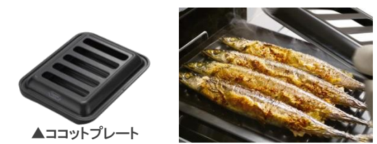
▲ココットプレート