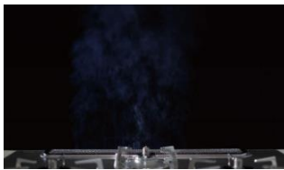
スモークオフ非搭載

グリル庫内の後方に搭載した専用バーナーで、焼き魚などの調理時に発生した煙やニオイを焼き切ります。リビングと一体になったキッチンや、気密性の高いマンションでも、脱煙・脱臭効果を発揮します。