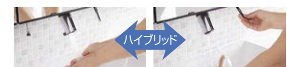
手洗いが自動でラクラク 水汲みにも手動が便利

手をふれずに差し出すだけでセンサーが感知し、自動で水が出てきます。花瓶の水汲みなどの連続吐水には、ハンドル操作で手動吐水ができます。自動吐水と手動吐水の切り替え操作は不要です。