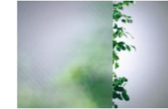
ミスト熱処理ガラス

割れにくく、割れても飛散しないミスト熱処理ガラスを採用。安全性の高いガラス面を実現。 (板厚4mm)