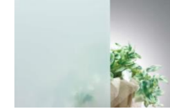
乳半合わせガラス

2枚の厚ガラスを乳白色の接着フィルムで加熱圧着したガラス。乳半調に光を通す半透明のガラスです。 (板厚4mm+4mm 合わせ)