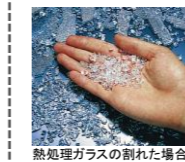
熱処理ガラスの割れた場合

熱処理ガラスは、普通のガラスの約3~5倍の強度を持つガラス。万一割れても、破片が小さな粒状になり、防衛性に優れています。