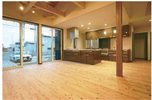
SEK-15 施工：渋谷建設株式会社