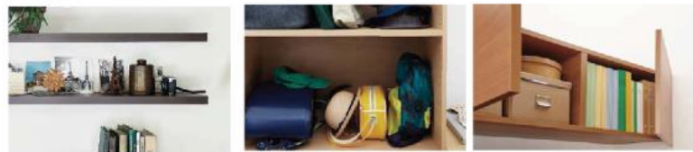
一枚棚 キャビネット キャビネット+扉・引出し