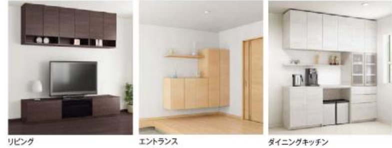
リビング エントランス ダイニングキッチン