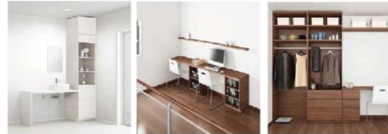
洗面・脱衣室 フリースペース コアストレージ