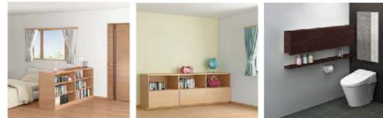
寝室 子供部屋 トイレ